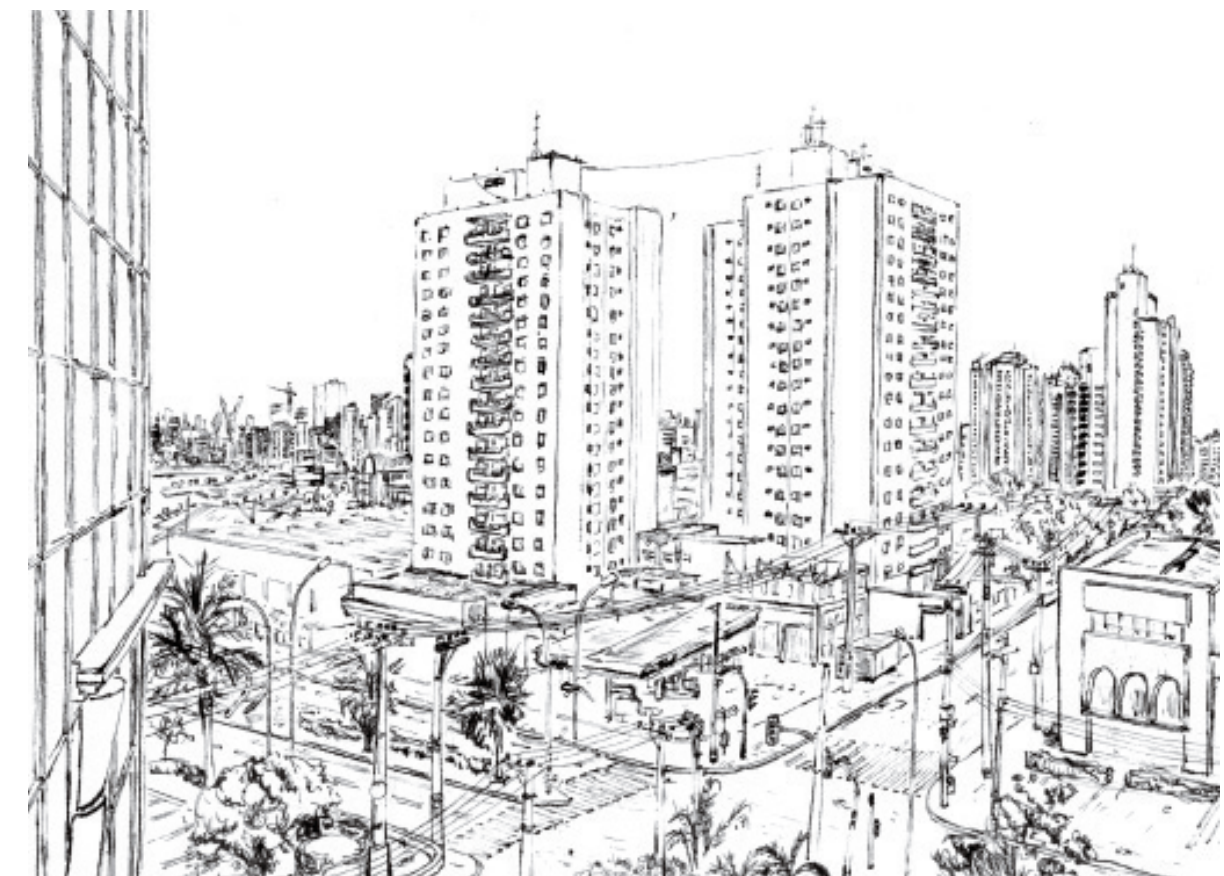
1 São Paulo teilweise als Negativbeispiel Ipanema: Strand als «demokratischer» Ort in Ipanema; Umkehrung der sozialen Klassen durch schönsten Blick von der Favela do Vidigal aus